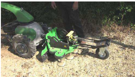
Rabot sur motoculteur