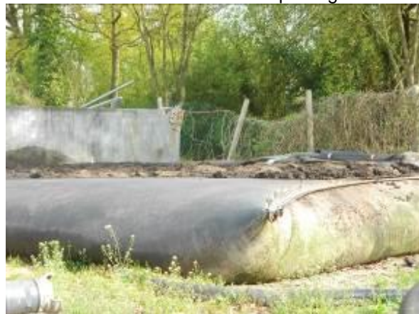
Boues en cours d'enlèvement avec ouverture de la poche

Les boues après floculation sont envoyées dans des poches filtrantes qui concentrent les boues. Ces poches sont habituellement placées au sein d'un lit de séchage existant et les filtrats peu chargés en Matières en suspensions (MES) percolent à travers le lit puis retournent en tête de la station d'épuration. Les poches sont ensuite ouvertes et les boues récupérées au tractopelle. La siccité obtenue devrait se situer entre 15 et 25 % de MS pour des boues urbaines selon le fournisseur.