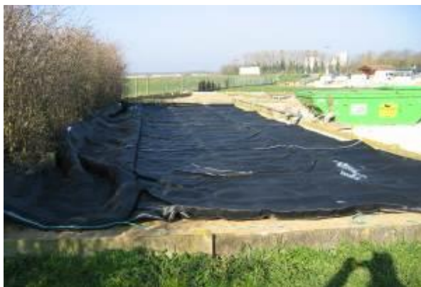
Poche en cours d'installation