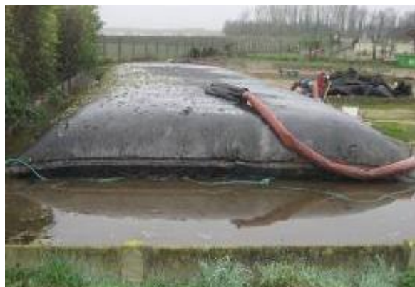
Poche en cours de remplissage