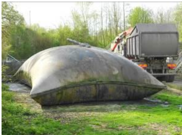
Poche trop remplie