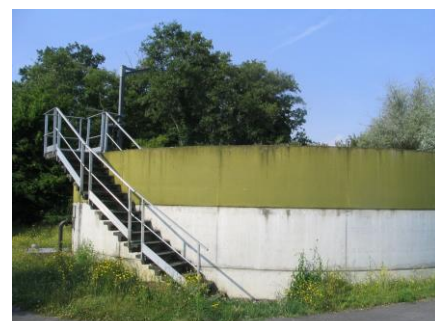
Silo stockeur Saint-Martin-en-Bière