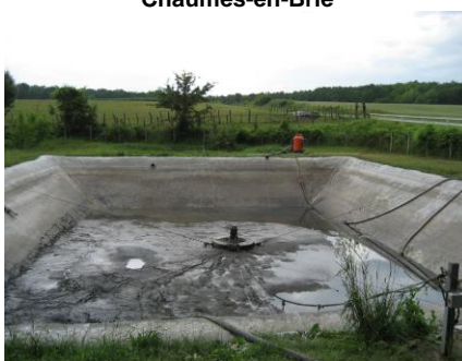
Lagune en cours de vidange Meigneux