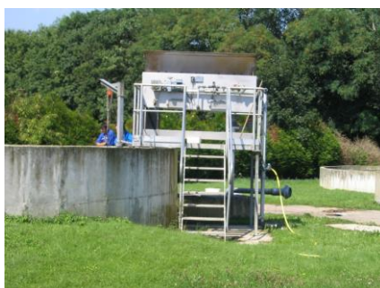
Table d'égouttage installée à l'extérieur Chaumes-en-Brie