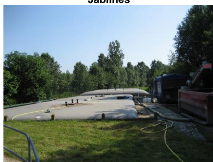
Citernes souples Blandy-les -Tours