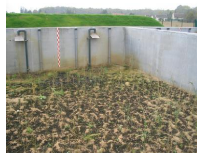
Lits après un mois de fonctionnement