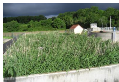
Lits plantés de roseaux (été)