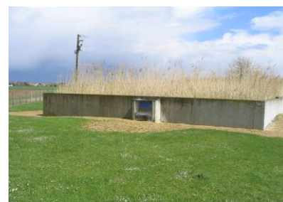
Lits plantés de roseaux (hiver)