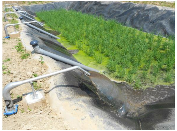
Lit planté de roseaux avec géomembrane